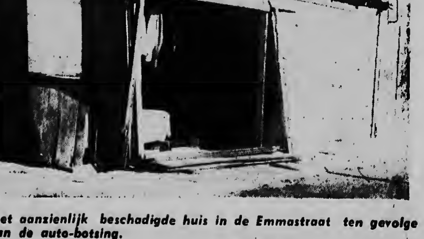
Het aanzienlijk beschadigde huis in de Emmastraat ten gevolge van de auto-botsing.